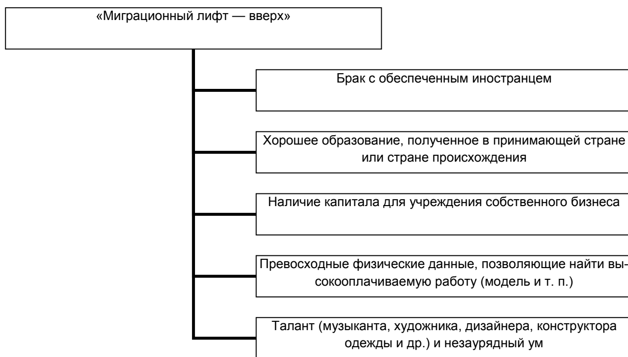
Рисунок 1. — Схематическое изображение понятия «миграционный лифт — вверх»

работу платят больше, они обязательно продолжают свой «миграционный коридор», несмотря на все риски и новые испытания, если главным для них являются деньги. Если же приоритетом для них является карьера, их «миграционный коридор» может трансформироваться в «миграционный лифт». Данное понятие мы рассматриваем в двух категориях: «миграционный лифт — вверх» и «миграционный лифт — вниз». Какие предпосылки могут существовать для иммигранток для поднятия «миграционным лифтом» наверх, т. е. в среду лучших представителей принимающего общества? Рассмотрим «миграционный лифт — вверх» (рисунок 1).